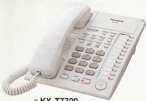
■ KX-T7720 ชุดลำโพงแบบ Speakerphone

สำหรับการปรับระดับเสียง และความคมชัดของหน้าจอได้อย่างรวดเร็ว