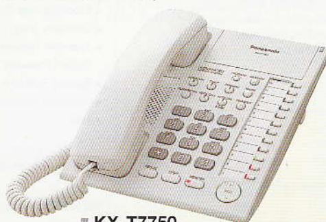
■ KX-T7750 ชุดลำโพงแบบ Monitor